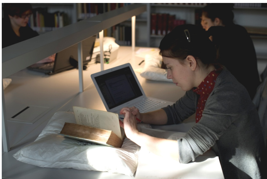
Onderzoek in de leeszaal van de Historische Collecties van de Universiteitsbibliotheek Antwerpen. [ST]

Het eindverslag van dit onderzoek wordt opgeleverd in april 2012. Daarin zullen behalve conclusies ook beleidsaanbevelingen voor de overheid en de bredere sector worden geformuleerd. Want nu al is duidelijk dat de Vlaamse Erfgoedbibliotheek als netwerkorganisatie de grote noden noch alleen, noch op korte termijn kan lenigen. Dat is een uitdaging en een verantwoordelijkheid die de middelen van de vzw ver overstijgt. We kunnen wel – zoals het decreet beoogt – impulsen geven en zo een motorrol vervullen. Daarom kiezen we in de komende beleidsperiode voor enkele inhoudelijke speerpunten, een efficiënte organisatievorm en een doorgedreven projectmatige aanpak die de grootste garantie geeft op expertiseborging en -verspreiding. Op die manier hopen we – stap voor stap – zowel dit prille netwerk als deze jonge sector de nodige groeikansen te kunnen bieden.