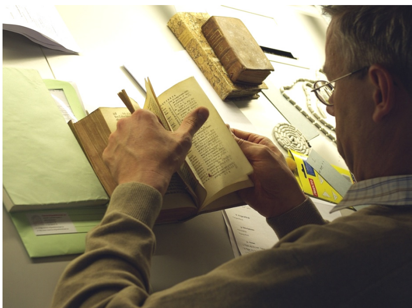
De Vlaamse Erfgoedbibliotheek organiseert vierdaagse workshops waarin aan de deelnemers de finesse van de analytische bibliografie worden bijgebracht.

Voor dit veld van erfgoedbibliotheeken in Vlaanderen en Brussel is de Vlaamse Erfgoedbibliotheek een belangrijk informatieplatform . Centraal daarbij staat de website die medewerkers van erfgoedbibliotheeken zo efficiënt en professioneel mogelijk tracht te informeren en te inspireren m.b.t. alle aspecten van hun werk (zie OD 1.6.). Deze bevat dossiers met handleidingen, tools, standaarden en andere hulpmiddelen (zie 6.2). Die worden door de medewerkers in binnen- en buitenland opgespoord en samengebracht of ontwikkeld in het kader van eigen projecten (zie OD 1.4.).