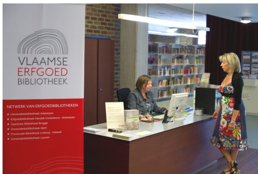
Banier van de Vlaamse Erfgoedbibliotheek in de Provinciale Bibliotheek Limburg. [ST]

Binnen dit netwerk staat kennisdeling en expertiseopbouw centraal. Daartoe worden – steeds in samenwerking – diverse projecten, trajecten en producten ontwikkeld. Alle samenwerkings-initiatieven zijn maatwerk voor de deelnemende partners; per voorgesteld project of traject kunnen zij bepalen of zij eraan deelnemen en in welke mate (zie 6.2.3.2). Daarbij is het uitgangspunt wel dat initiatieven steeds door het gehele netwerk worden gedragen , dus ook door de partners die niet rechtstreeks participeren. Als dit past binnen de projectdoelen kunnen ook andere instellingen of organisaties worden betrokken. Daarbij denken we in eerste instantie aan bibliotheken die zich echt als erfgoedbibliotheek (willen) profileren. De Vlaamse Erfgoedbibliotheek kan ook projecten initiëren op suggestie van derden, als deze passen in de eigen beleidslijnen en één of meer partners bereid zijn eraan deel te nemen.