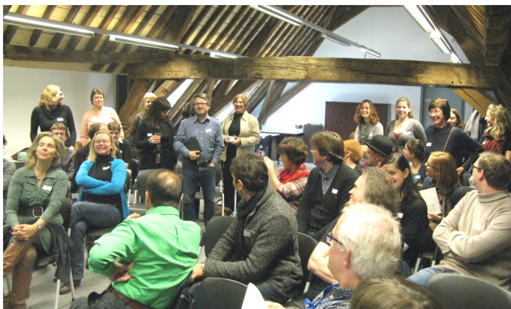
Medewerkers van de partnerbibliotheken stellen zich voor op de ontmoetingsdag van het Flandria.be-project in de Maurits Sabbebibliotheek van de KU Leuven (februari 2012).

Voor een voorbeeld van deze werkwijze en de bijhorende documenten verwijzen we naar bijlage 4.