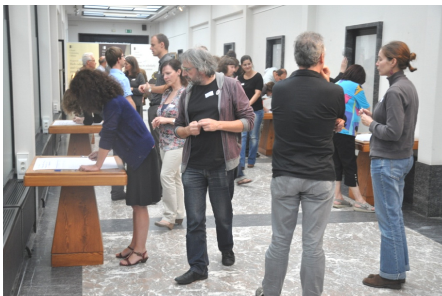
In de Gentse Boekentoren geven deelnemers aan het Overlegplatform Erfgoedbibliotheken feedback op stellingen via de 'dotmocracy'-methode (oktober 2011).

Het Overlegplatform is een open vergadering die kan worden bijgewoond door alle medewerkers van erfgoedbibliotheken in Vlaanderen en Brussel. Op de sessie van 05.10.11 in Gent werden aan de veertig deelnemers o.a. de eerste resultaten van het onderzoek voorgesteld en enkele beleidsuitdagingen en -aanbevelingen afgetoetst .