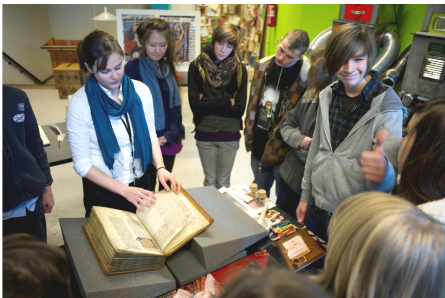
Met het educatieve project 'De Erfgoedkoffer' maakt de Openbare Bibliotheek Brugge haar middeleeuwse manuscripten toegankelijk voor leerlingen van het secundair onderwijs. [ST]

De Vlaamse Erfgoedbibliotheek is het ankerpunt voor de volledige erfgoedgemeenschap rond geschreven, gedrukte en digitale collecties , bewaard in erfgoedbibliotheken in Vlaanderen en in het tweetalige gebied Brussel-Hoofdstad. Ze is een kwaliteitsvolle netwerkorganisatie en kennismakelaar , die de erfgoedbibliotheeksector versterkt vanuit een constructieve en projectmatige samenwerking met haar partners. Samen ontwikkelen zij een collectiebeleid rond Flandrica, zetten zij in op de duurzame zorg voor erfgoed en verhogen zij de toegang tot en de zichtbaarheid van deze collecties. Via transparante en open communicatie deelt de Vlaamse Erfgoedbibliotheek de zo verworven expertise en instrumenten met de ruimere bibliotheeksector. Op die manier draagt ze bij aan de kritische maatschappelijke reflectie en ondersteunt ze de brede erfgoedgemeenschap bij het waarderen en doorgeven van het bibliotheekerfgoed.