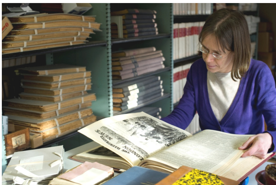
Bladeren door ons collectief geheugen in het tijdschriftenmagazijn van de Centrale Bibliotheek van de KU Leuven. [ST]

Iedereen is ervan overtuigd dat de oude boeken, kranten en handschriften deel uitmaken van ons intellectueel patrimonium en dat bibliotheken ze dus zorgvuldig moeten bewaren voor de toekomstige generaties. Maar bewaren alleen volstaat niet. Als we ook in de verre toekomst een kritische en zelfbewuste maatschappij mogelijk willen maken, zullen tekst, beeld en geluid uit het verleden beschikbaar moeten zijn. Door het ontsluiten van collecties en een actieve bemiddeling tussen diverse gebruikers en collecties zorgen erfgoedbibliotheek voor de borging van kennis en voor hergebruik. Door op een democratische wijze toegang te verlenen tot de bronnen van ons cultuurhistorisch verleden dragen ze op een unieke manier bij aan het geheugen en de identiteit van de cultuurgemeenschap.