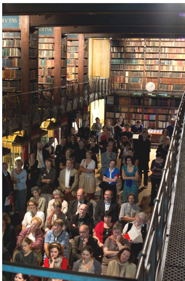
Lancering van de Vlaamse Erfgoedbibliotheek in de Erfgoedbibliotheek Hendrik Conscience (juni 2010). [ST]

Om op het huidige elan door te kunnen gaan, onze organisatie te kunnen verankeren en al onze decretaale opdrachten te kunnen realiseren, is een groeiscenario met een uitgebreidere, vaste ploeg een essentiële voorwaarde. De voorbije jaren was die garantie er niet, integendeel. Hoewel het decreet voorziet in een werkingssubsidie van minimaal 300.000 euro werden deze middelen in 2010, 2011 en 2012 niet volledig uitgekeerd, en dat terwijl het de nationale bibliotheken van onze buurlanden zijn die als benchmark gelden. Net als de rest van de cultureel-erfgoedsector moest de Vlaamse Erfgoedbibliotheek inleveren, zij het procentueel beduidend meer dan andere, gelijkaardige organisaties die door het Cultureel-erfgoeddecreet worden betoelaagd. 3 De timing voor deze besparingen was bovendien erg ongelukkig: ze deed zich namelijk voor op een moment dat de vzw op volle toeren begon te draaien. Dat dit onvermijdelijk een weerslag heeft gehad op de middelen aan personeel en bijgevolg ook op de slagkracht van de Vlaamse Erfgoedbibliotheek hoeft geen betoog. En dat is jammer want nieuw onderzoek toont aan dat de uitdagingen voor de sector nog steeds zeer groot zijn.