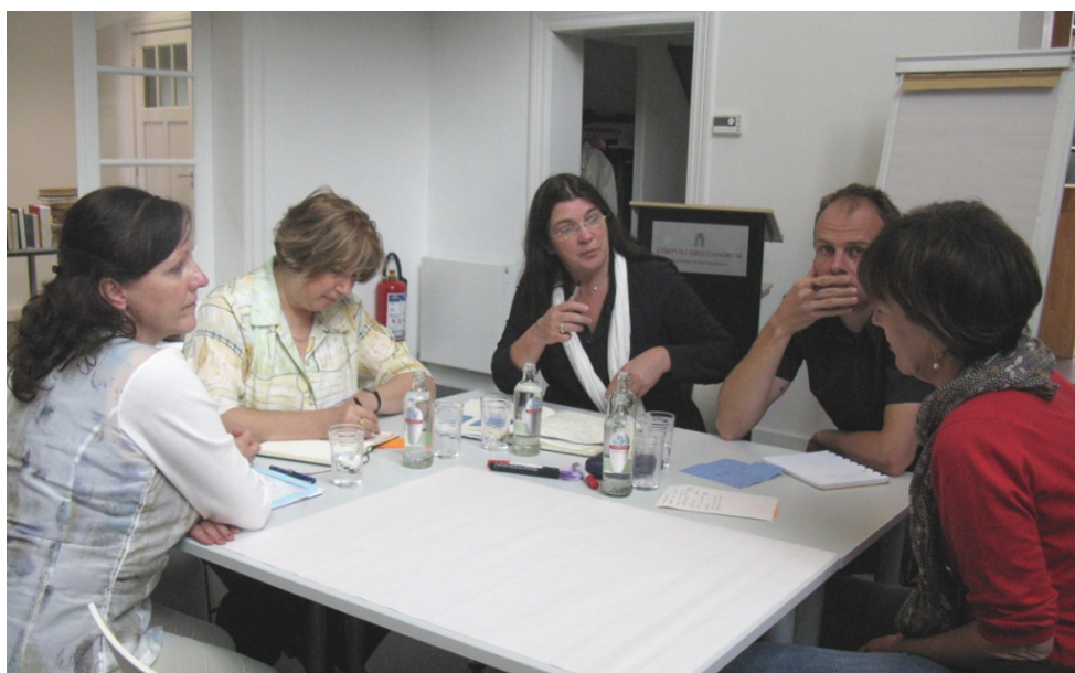
Brainstormen over de rol en werking van de Vlaamse Erfgoedbibliotheek op de beleidsdag in Bibliotheek & Kenniscentrum Corpus Christianorum (september 2011).