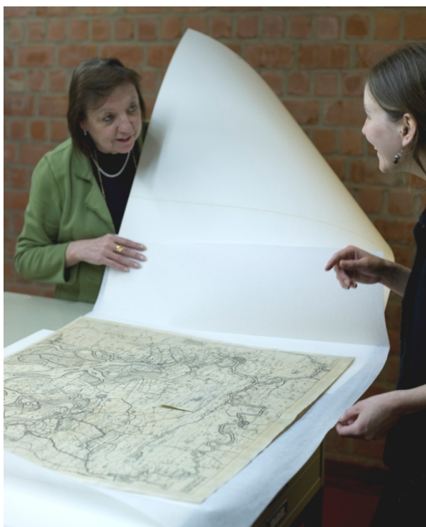
Een erfgoedbibliotheek als Bibliotheca Wasiana bezit niet alleen boeken, kranten en tijdschriften maar ook allerlei andere materialen, zoals plannen. [ST]

Ervaringen, noden en andere signalen van de partners worden door hen ook gesignaleerd naar relevante derden zoals erfgoedbibliotheek en andere collectiebeherende instellingen, expertisecentra, vormingsinstellingen, beleidsmakers en dergelijke meer.