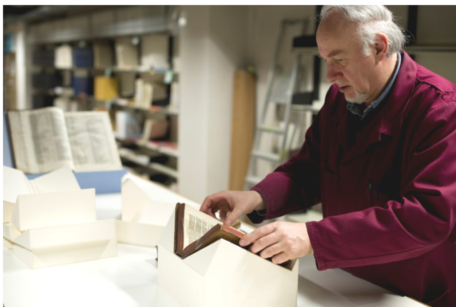
Medewerkers van de Openbare Bibliotheek Brugge zijn opgeleid in technieken waarmee oude boeken op een verantwoorde manier kunnen worden tentoongesteld. [ST]

Om de cultureel-erfgoedgemeenschap te sensibiliseren en te experimenteren met de beginselen van cultureel ondernemerschap coördineert de Vlaamse Erfgoedbibliotheek het fondsenwervingsprogramma 'Adopt-a-Book' (OD 6.3.).