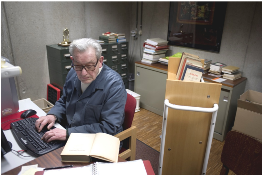
De bibliothecaris van de Norbertijnenabdij Averbode beschrijft werken in de catalogus. [ST]

De zes partners van de Vlaamse Erfgoedbibliotheek willen hun bibliotheekwetenschappelijke expertise bundelen, verdiepen en verbreden via twee innoverende projecten: de registratie van herkomstkenmerken (OD 4.4.) en de ontsluiting van handgeschreven materialen (OD 4.5.). In beide gevallen zal de internationale praktijk onderzocht worden en vertaald naar Vlaanderen via de opmaak van handleidingen.