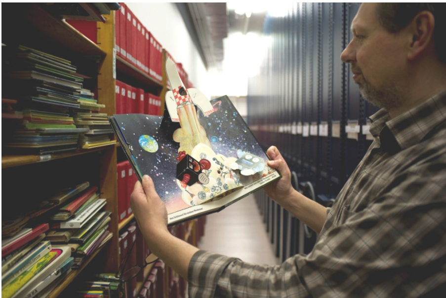
De Erfgoedbibliotheek Hendrik Conscience bezit een rijke kinderboekencollectie. [ST]

Een belangrijke hefboom in het collectiebeleidverhaal is de piste dat uitgevers hun werken niet alleen in de Koninklijke Bibliotheek van Brussel gaan deponeren, maar ook bij een of meerdere erfgoedbibliotheken. Daarom zal de vzw, in samenwerking met alle betrokkenen, de mogelijkheden en haalbaarheid onderzoeken van een aanvullend decretaal depot als instrument in een pro-actief Vlaams erfgoedbeleid.