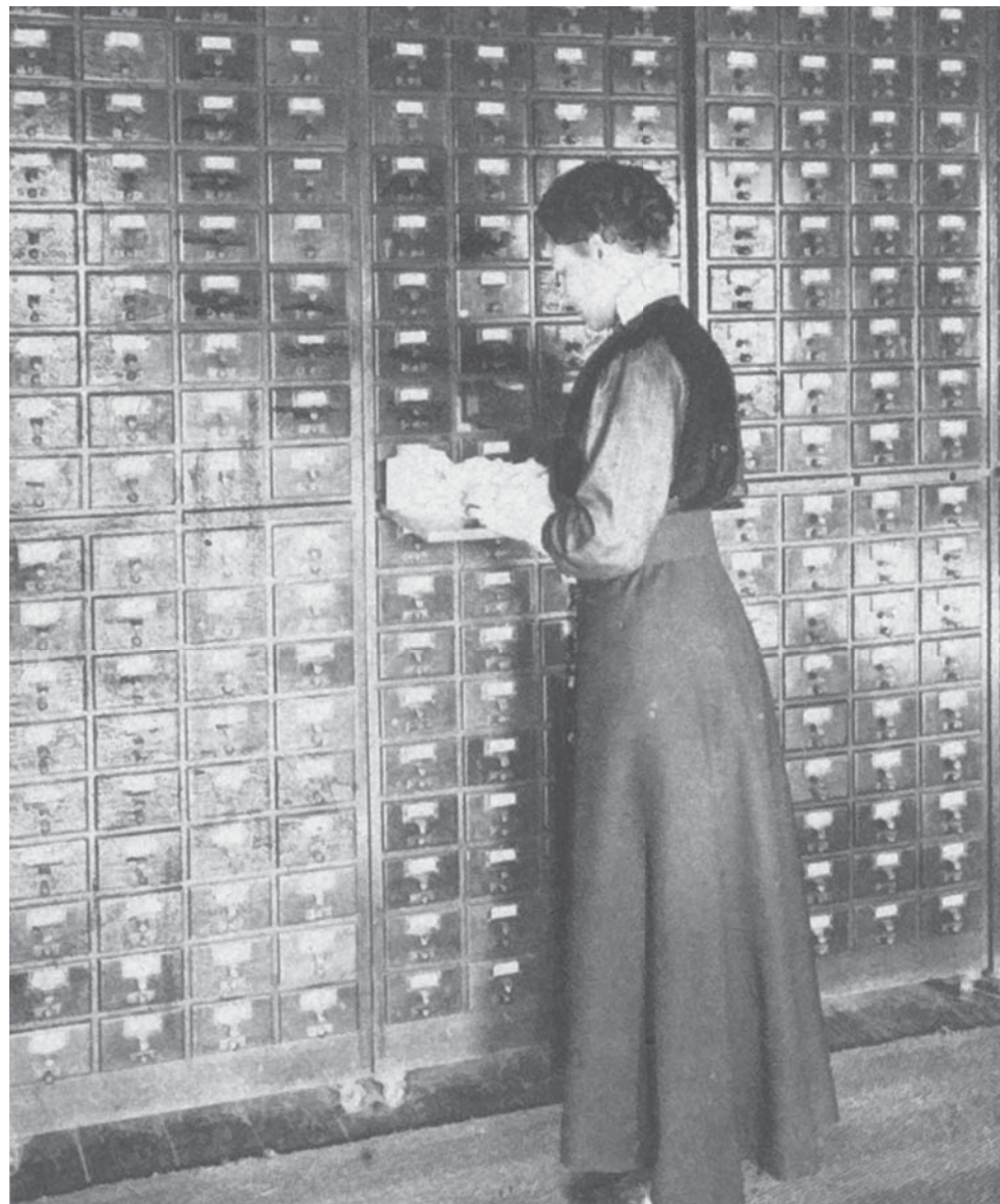
Comment on consulte les répertoires de l'Institut de Bibliographie, L'événement illustré: revue hebdomadaire, documentaire, artistique et littéraire , 16/12/1916, In Flanders Fields Museum

Maar ook andere bibliotheken, archieven en musea hebben belangrijke krantencollecties. Die zijn vaak regionaal of thematisch van insteek. De tien andere bewaarinstellingen die meewerkten aan Nieuws van de Grootte Oorlog zijn samen goed voor nog eens 100 000 pagina's. In Nieuws van de Grootte Oorlog bevinden zich dus niet alleen de grote nationale krantentitels, maar ook lokale kranten, vakbladen, huis-aan-huisbladen, politieke en culturele bladen, de vakbondspers en verenigings- en parochiebladen. Die zijn vanaf nu allemaal gemakkelijk toegankelijk voor wetenschap, onderwijs en het grote publiek.