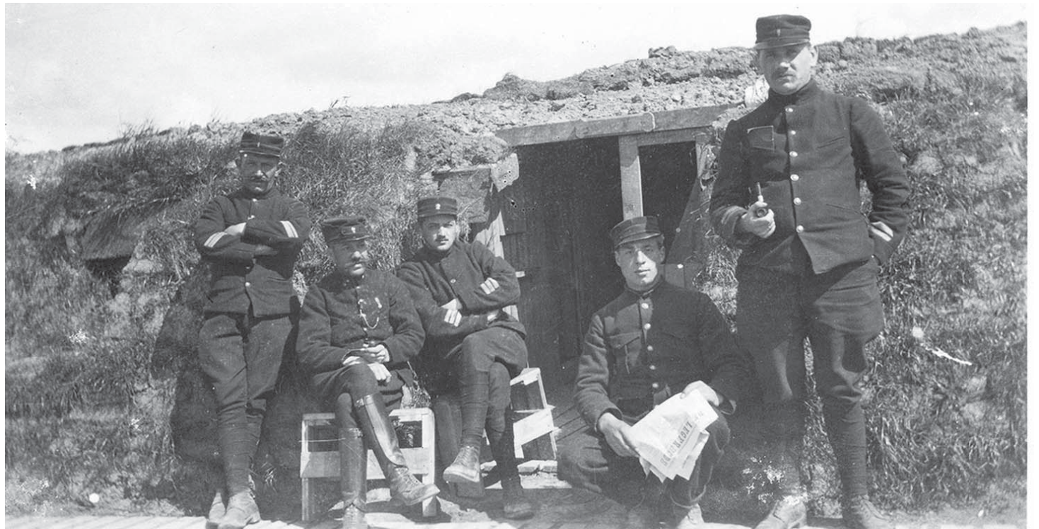
Groepsfoto in de loopgraven, IJzerfront, 1914-1918