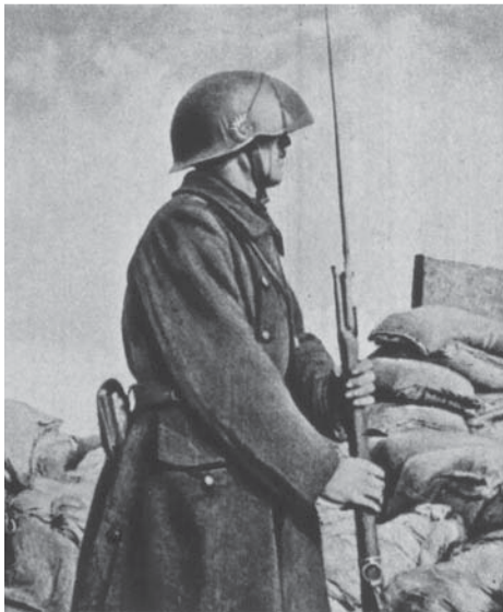
Belgische schildwacht met nieuwe stalen helm, De oorlog in beeld , 01/10/1918, In Flanders Fields Museum

Nieuws van de Grote Oorlog heeft als doel het digitaliseren en publiek toegankelijk maken van al het persmateriaal uit de periode 1914-1918, met uitzondering van de sluikpers en gecensureerde dagbladpers. Deze kranten werden immers al grotendeels gedigitaliseerd binnen het project The Belgian War Press van CegeSoma, het federale Studie- en Documentatiecentrum Oorlog en Hedendaagse Maat-