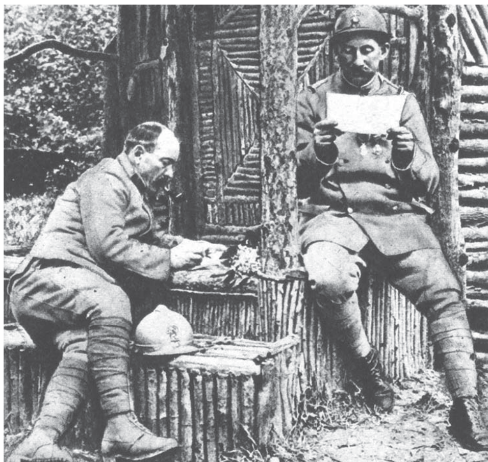
La lettre aux chers absents, L'événement illustré: revue hebdomadaire, documentaire, artistique et littéraire , 16/12/1916

Onder de naam Nieuws van de Groote Oorlog gingen deze organisaties samen met dertien Vlaamse erfgoedinstellingen aan de slag om tienduizenden van deze kwetsbare documenten duurzaam te bewaren voor de toekomst. Want