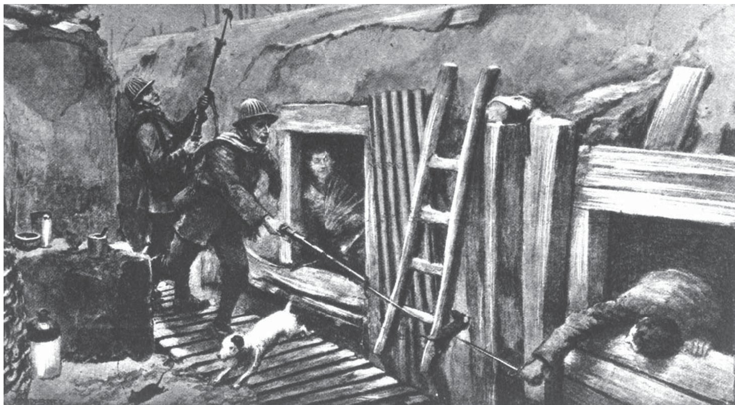
La chasse aux rats, L'événement illustré: revue hebdomadaire, documentaire, artistique et littéraire , 16/12/1916, In Flanders Fields Museum